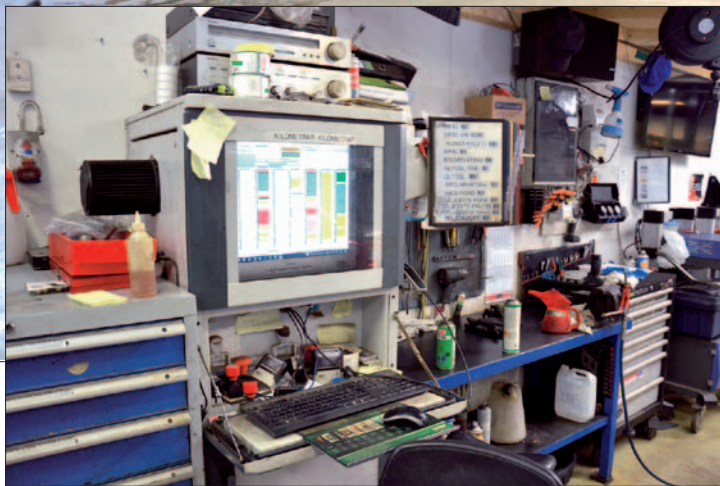
Mekaanikot käsittelevät työmääräystä suoraan tietokoneelta käsin. Viivakoodinlukija nopeuttaa tarvikkeiden lisäämistä.