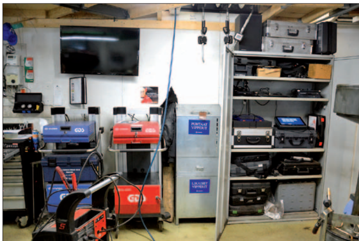
Useiden merkikiedustusten mukana tulee mittava määrä erilaisia merkikokoisia erikoistyökaluja. Pelkästään diagnoositestereitä korjaamolle on kertynyt yli 15.

lilasvaihtoja varten. Yritys käyttää ja myy Pilkingtonin valmistamia tuulilaseja.